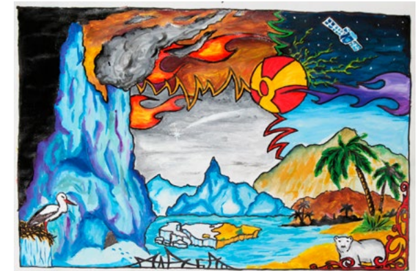
Rys. Karolina Moc / Polska